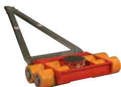
Les modèles JL sont livrés avec barre directrice